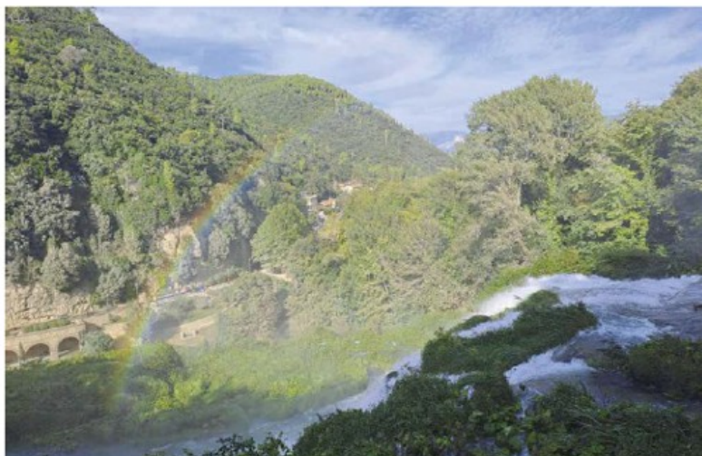
Accanto, uno scorcio della Cascata delle Marmore; sotto, Palazzo Spada; in basso, un vitigno a bacca nera; a fondo pagina, un ritratto di Sal De Riso