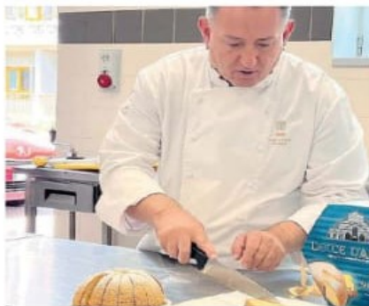
La prima giornata ieri mattina l'iniziativa all'istituto alberghiero Casagrande-Cesi

gala. Fino a domani sera per i visitatori sarà come fare un lungo viaggio attraverso le cantine umbre in cui si potranno sorseggiare i vini locali abbinati alle eccellenze del territorio. Inoltre da non perdere masterclass, eventi, degustazioni, esperienze immersive, musica e folklore che